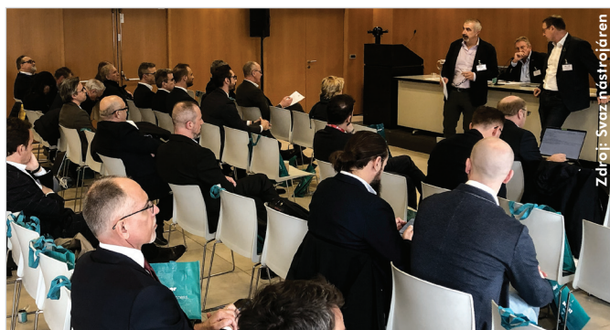
Součástí zasedání organizace ISTMA jsou diskuze předních odborníků z praxe i z oblasti výzkumu.

Mediálním partnerem akce je časopis MM Průmyslové spektrum.